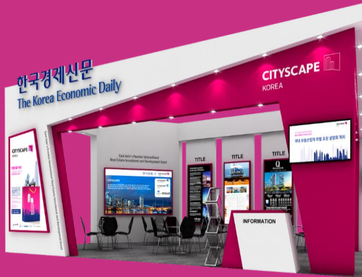
ZONE B 국내부동산존