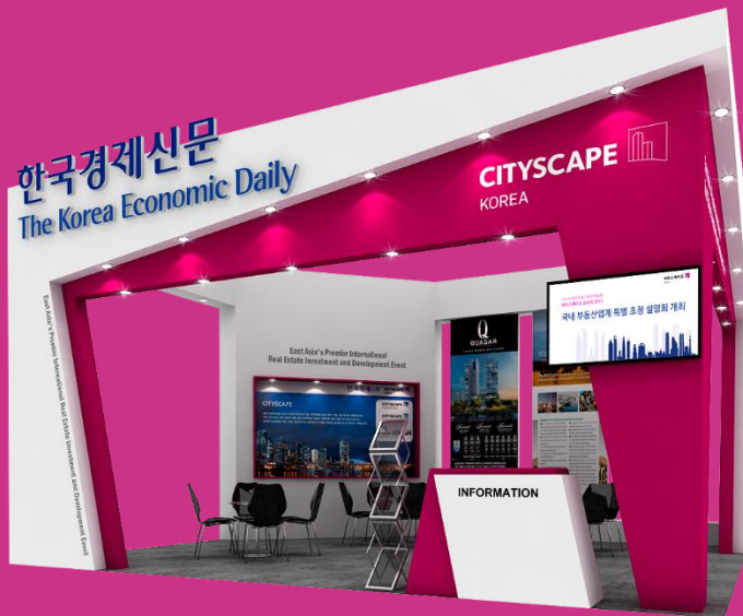
ZONE B 국내부동산존