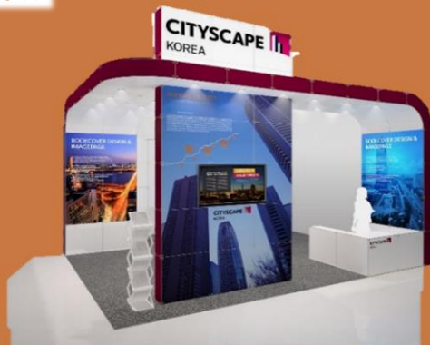
Type G Type H