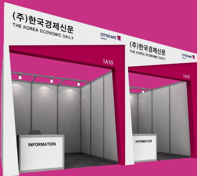
ZONE B 국내부동산존